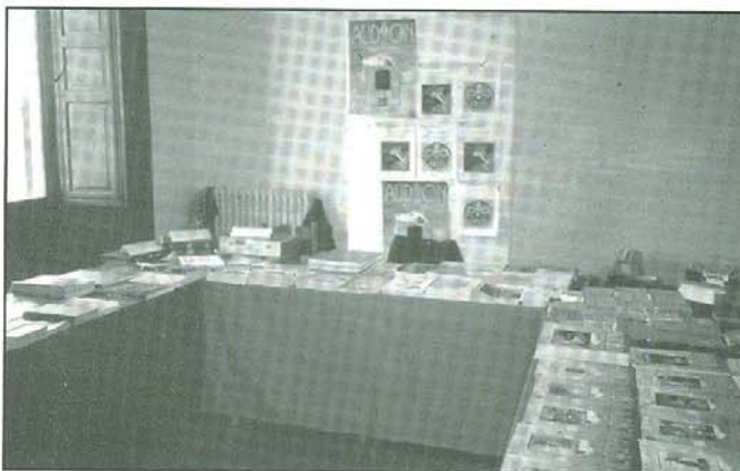
1. Le pubblicazioni librarie e discografiche di Audion.

Un'altra sala ospitava la notevole quantità di libri, riviste e cd pubblicati dalla rivista Audion.