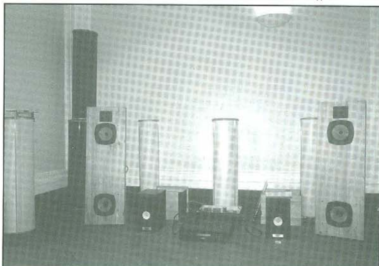
2. La sala di ascolto con 300B top level, diffusori a dipolo e trattamento acustico della Acustica Applicata.

Si è trattato perciò di un evento prettamente culturale, teso, soprattutto a sostenere la musica e la sua fedele riproduzione. Gran parte delle apparecchiature audio esposte fanno parte