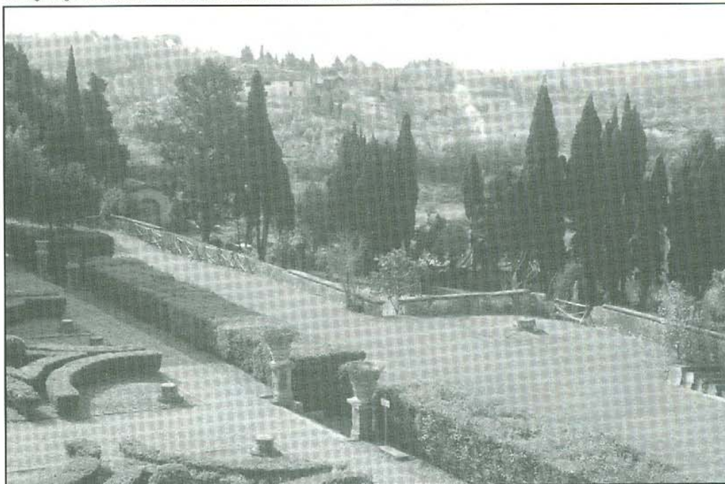
4. I magnifici giardini all'italiana di Villa Caruso. Il connubio tra arte ed alta fedeltà si sposa davvero bene.

Per tutti coloro che fossero interessati a conoscere la vita e le incisioni di Caruso Audion ha disponibile una bellissima biografia intitolata Caruso , scritta da Riccardo Vaccaro con la presentazione di Ruffo Titta jr. Si tratta di un volume di ben 467 pagine scritte con amore dall'autore e che ci permette di entrare nel mondo magico di quello che fu definito "il tenore".